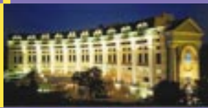
Hôtel Hilton de Hanoi – Vietnam. Hilton hotel in Hanoi – Vietnam.