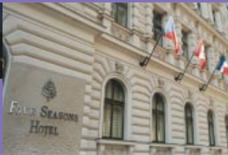
Hôtel Four Seasons de Prague – République tchèque.