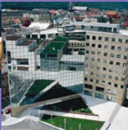
Immeuble de bureaux "International Business Centre" Prague – République tchèque.