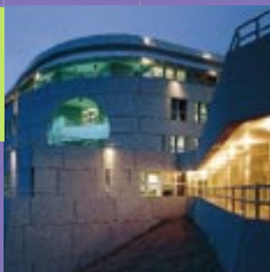
Siège de la Banque Européenne d'Investissement – Luxembourg. European Investment Bank head office – Luxembourg.