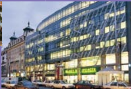
Immeuble de bureaux et de commerces Myslbek, Prague – République tchèque.